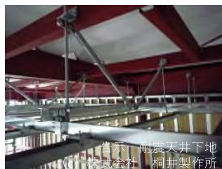
告示 耐震天井下地 (c) 株式会社 桐井製作所