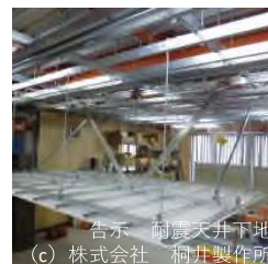
告示 耐震天井下地 (c) 株式会社 桐井製作所